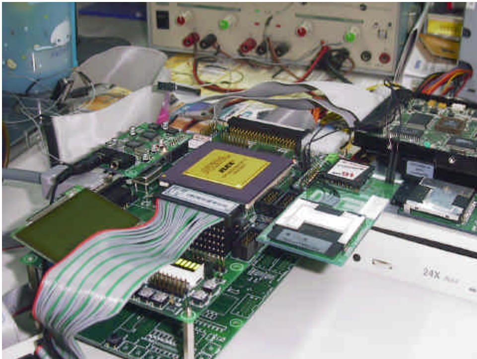
[그림6-3] 검증용으로 사용한 FPGA system Pic #1

검증용 FPGA system은 기본적으로 FLEX10K250과 i80c32에 필요한 external RAM/ROM, 그리고 인터페이스 할 device들간의 interface 및 UART, Graphic LCD, character LCD, KEY, POWER로 구성되어 있으며 HDD와 CDROM을 위한 충분한 power공급을 위하여 ATX power를 사용하였다. FPGA 검증용 LED와 7 SEG로 FPGA의 동작을 검증했으며 FPGA와 연결된 PIN들도 별도의 프로젝트 파일로 모두 on/off하여 FPGA를 검증하였다. 다음 사진은 검증용으로 제작한 FPGA board이다.