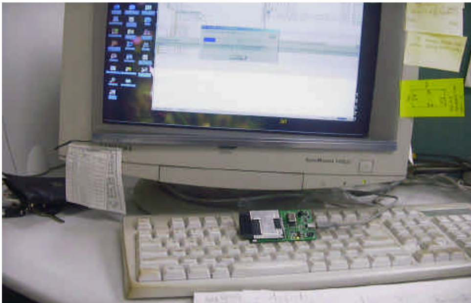
[그림6-7] USB writer로 Media에 write하는 모습